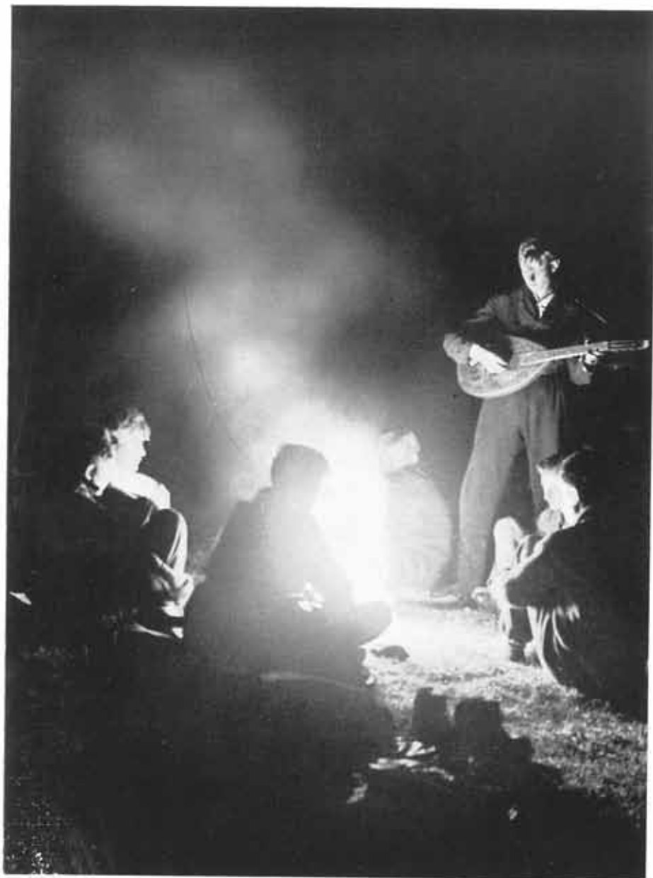
Wandervogel „Das Nest“