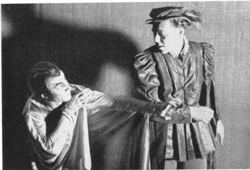
Aus der „Faust“-Aufführung 1946

Der „Rethelkreis“ hält die Erinnerung an den Geist der immer noch in Trümmern liegenden Schule wach und pflegt weiter die herzlichen Beziehungen, wie sie im früheren Kollegium üblich waren, d. h. also zwischen all denen, die das Glück und die Ehre hatten, längere Zeit an der „Rethelschule“ tätig gewesen zu sein.