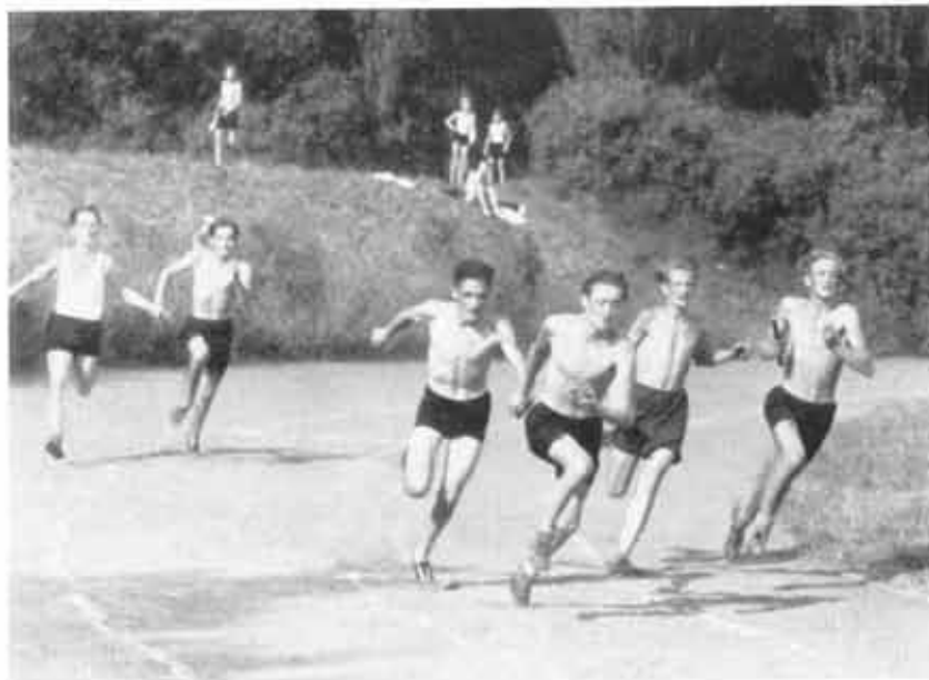
Sommerfest im Rather Waldstadion: Kampf der Klassenstaffeln