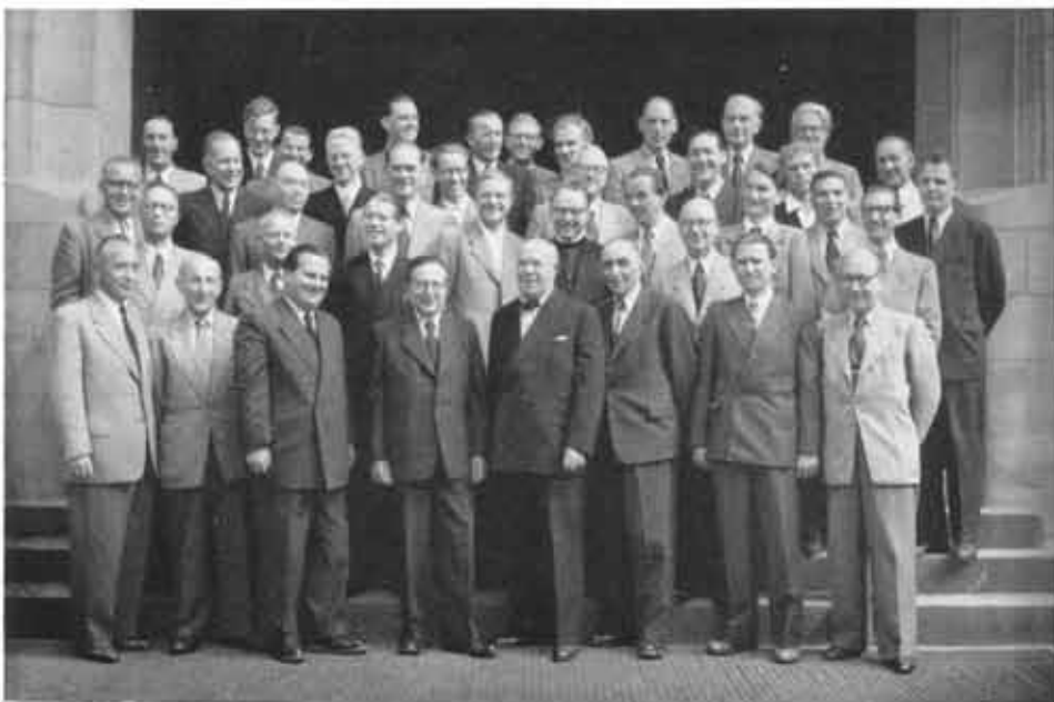
Das Lehrerkollegium des Jacobi-Gymnasiums im Jahre 1953