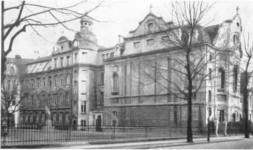
DIE ALTE RETHELSCHULE

Diese Festschrift berichtet aus dem Leben unserer Schule. Sie wurde vor fünfzig Jahren aus der Taufe gehoben. Das Gebäude an der Rethelstraße wurde zwar durch Bomben zerstört, doch die Schule selbst lebte unter neuem Namen weiter. Als Jacobi-Gymnasium setzt sie die Tradition der alten „Rethelschule“ fort, geht aber in gewandelter Zeit und einer sich wandelnden Welt auch neue Wege.