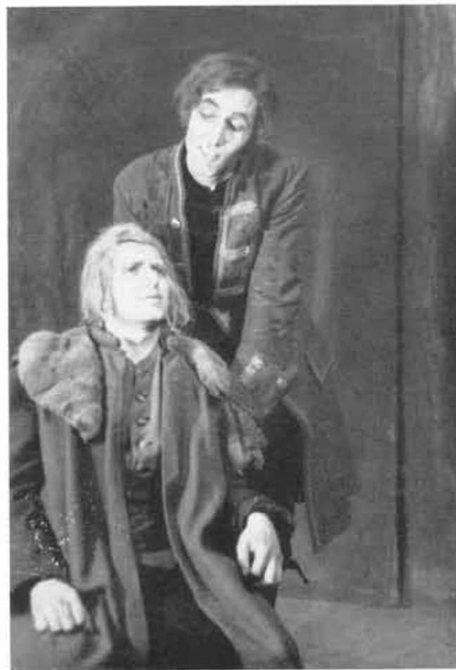
Aus der „Räuber“-Aufführung 1948

Unsere Schule umfaßte bei ihrer Weiterbildung 11 Klassen und 2 Sonderlehrgänge. Dem Schulgebäude des Leibniz-Gymnasiums, in dem sie noch heute untergebracht ist, fehlte einfach alles, was das Leben einer Schule außerhalb des Unterrichts zu fördern geeignet ist. Sogar heute, nach 8 Jahren des Zusammenbruchs, haben wir weder Turnhalle noch Aula und denselben von Ruinen umgebenen, nüchternen Schulhof. Zwar sind die Klassenräume wieder mit Türen und Fenstern versehen, jedoch auch in ihrem heutigen Zustand