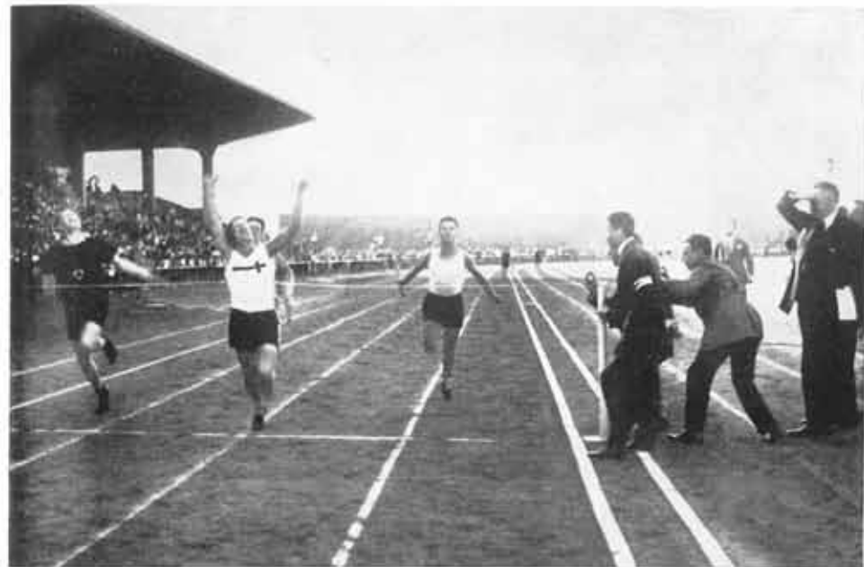
Sportfest der Höheren Schulen: Sieg der „Rethel“-Staffel über 4x100 m