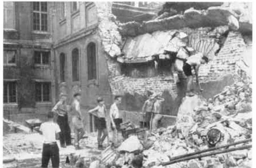
1949: Jungen von George School und Jacobi-Gymnasium bei gemeinsamer Arbeit in den Trümmern der Rethel-Schule